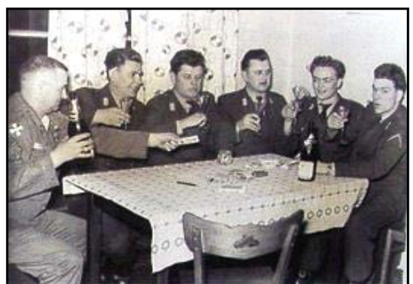
Anschließend in der Kantine Wagner