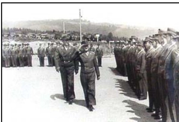
Kommandeur und S3 - Offizier nehmen die Front ab