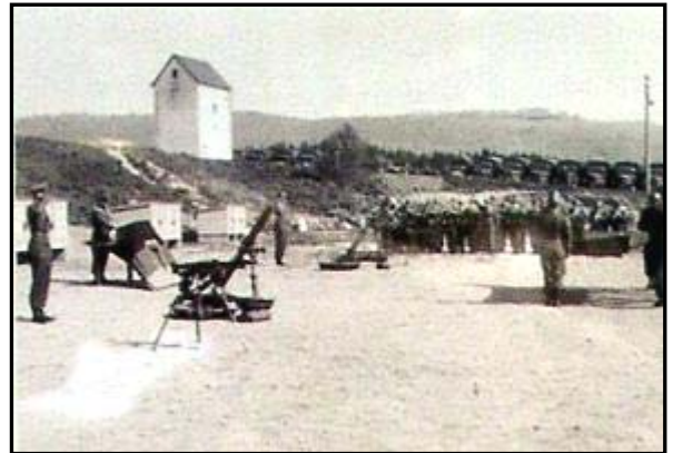
Vereidigung vor dem Gebäude 195, September 1957