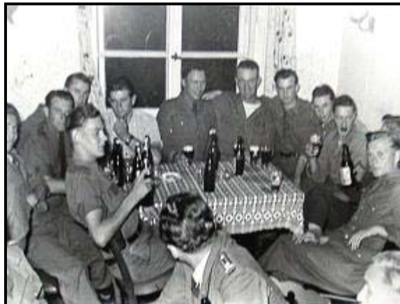
Mit amerikanischen Kameraden in der Kantine Wagner