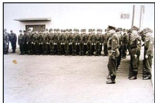
Antreten des BGS vor dem Gebäude 630