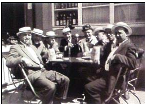
Vatertagsausflug nach Schweinfurt