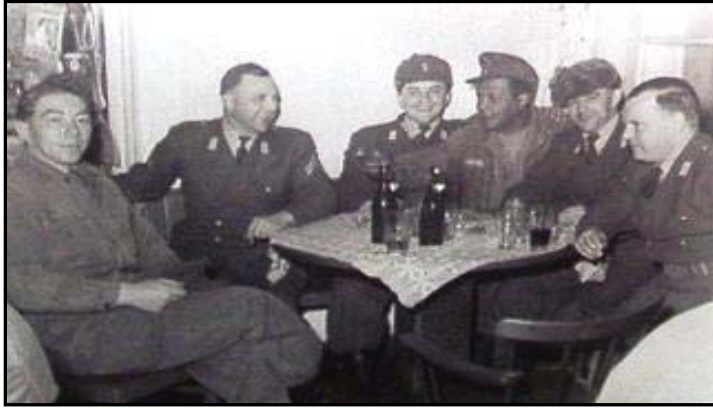
Mit amerikanischen Kameraden in der Kantine Wagner