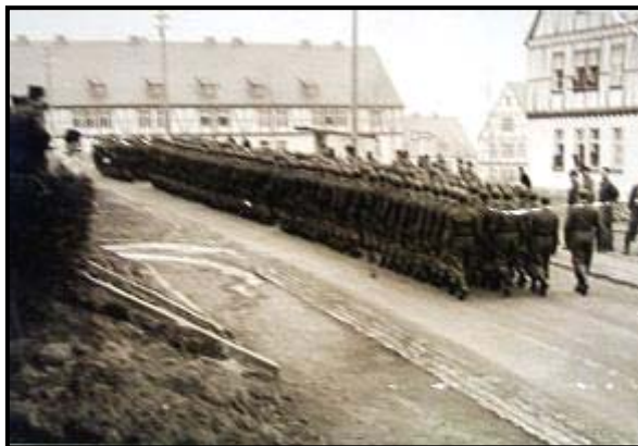
BGS auf dem Marsch durch das Truppenlager