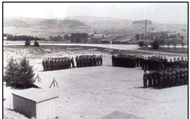
Das Bataillon steht zur Verteidigung auf dem Antreplatz vor dem Gebäude 195

Kompaniefeldwebel ist ein Stabsunteroffizier!