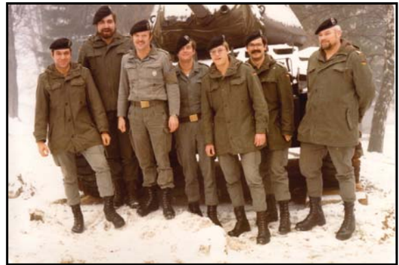
Kompanieführungsgruppe (vor dem Kompaniegebäude 193 am M-41)