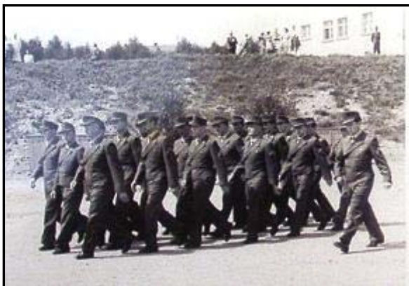
Auf dem Marsch zur 1. Verteidigung: die Unteroffiziere der Stabskompanie.

Kompaniefeldwebel ist ein Stabsunteroffizier!