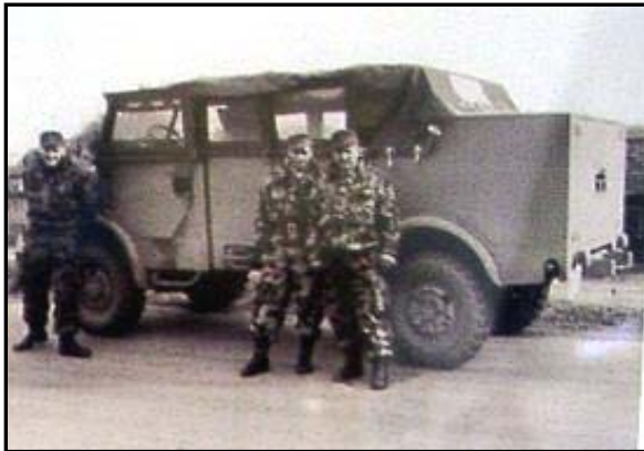
Manöver im Raum Amberg, Februar 1957