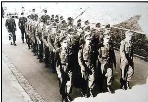
BGS im Truppenlager Wildflecken