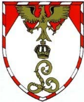
3. / PzAufkIBtl 12